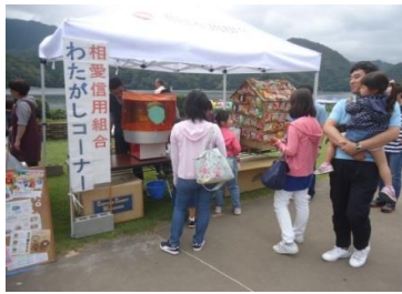
10月6日 相模湖ふれあい広場