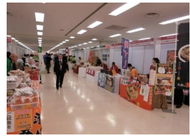
10月30日 2019 しんくみ食のビジネスマッチング展