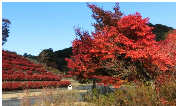
宮ヶ瀬湖鳥居原園地の紅葉