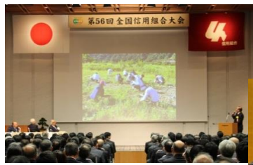
10月18日 カワラノギクの保護活動に対して 「しんくみの日週間表彰」を受賞した