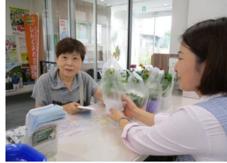
9月1日 しんくみの日週間 花のポットプレゼント